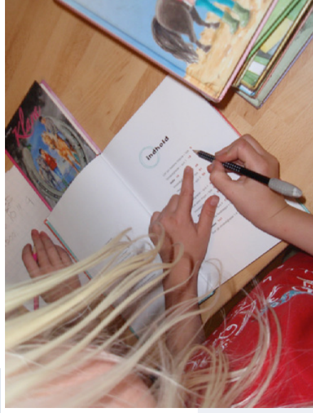
Der fandtes tal mange steder, fx i bøger.