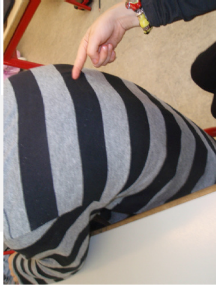
Elev 3. klasse: "Det var en god oplevelse at tegne tal på ryggen".

Den næste del af forløbet foregik på hele skolens område. Eleverne gik ud sammen med den makker, de lige havde været sammen med. De havde et lille hæfte og en blyant med hver. De skulle nu lede efter tal alle mulige steder på skolen. Når de fandt et tal, skulle de skrive tallet ned i deres hæfte.