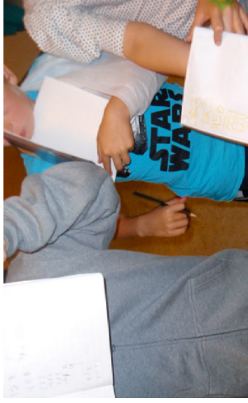
Det kunne godt være svært at få tallene placeret, så enerne stod over hinanden osv.

De skulle forsøge at skrive tallene, så enerne stod over hinanden osv. Vigtigst var det dog at finde tallene og øve sig i at genkende enerne, tieren og hundrederen. Hvert par fik et æggeuret med og skulle komme tilbage igen, når æggeuret ringede, ca. efter 10 minutter.