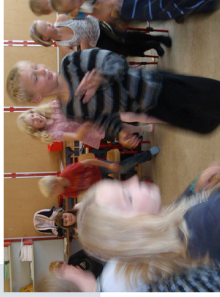
3D casen Tal-salat skaber trykthed i at bruge tallenes placering, glæde og motivation.

Alle elever fik en stol at sidde på i en rundkreds. Hvis ens tal blev nævnt (eller skrevet), skulle man bytte plads. På det tidspunkt, alle elever forstod øvelsen, blev en stol taget væk. Den elev, der ingen stol fik, hviskede de nye tal til læreren. Der blev øvet med alle 4 trin. Når der blev sagt "Tal-salat", byttede alle.