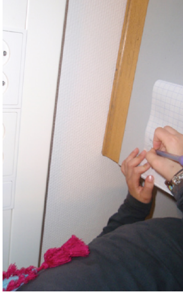
Der kunne findes tal rigtig mange steder

Eleverne arbejdede individuelt og skrev ned på post-it. Sedlerne blev efterfølgende hængt op, og eleverne fik set hinandens sedler. Sedlerne blev gemt til gangen efter.