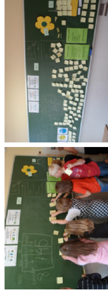
Den næste 3D case var fælles.